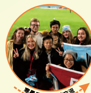
寒暑假海外院校交流