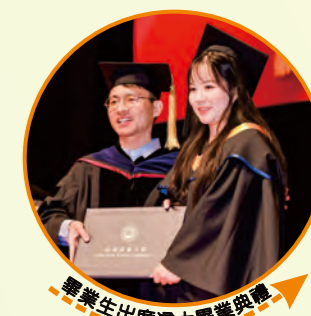
畢業生出席港大畢業典禮

校園二期完全投用後，北師港浸大將升級跨越到「一校兩區」。兩個校區分布在會同古村兩側，也將推動大學校園與古村文化深度融合，讓這座有著近300年歷史的古村，因大學與社區、產業與科研的鏈接增添更多生機與活力。