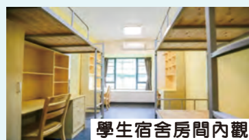
學生宿舍房間內觀