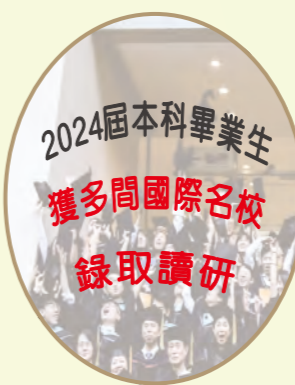
2024屆本科畢業生 獲多間國際名校 錄取讀研